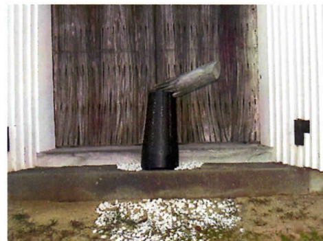
土蔵入口に飾られたオブジェ