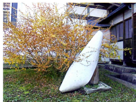
母屋前に飾られたオブジェ