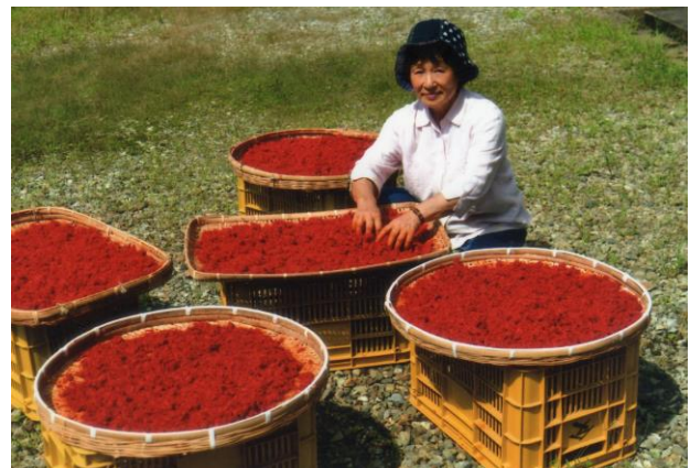
「花ねせ」作業で鮮やかに発色した紅花

4月に紅花の種を撒き、その後は間引きや雑草取り作業を行い、紅花が伸びると倒伏防止の杭打ち作業を実施。半夏生の頃から次々と開花する紅花を、7月に連日皆で摘み取り、8月には摘み取った紅花から紅餅を作りました。