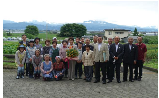
知事のほのぼのの訪問 令和2年7月7日

日本農業遺産に認定された山形県の『最上紅花』の振興のため、より一層尽力される県知事の意気込みが感じられるひと時でした。